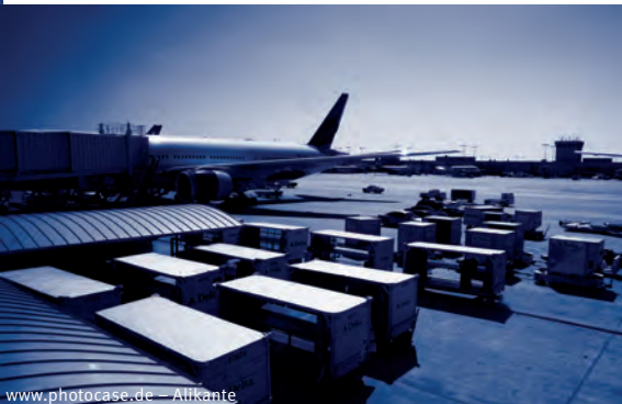
www.photocase.de – Alikante